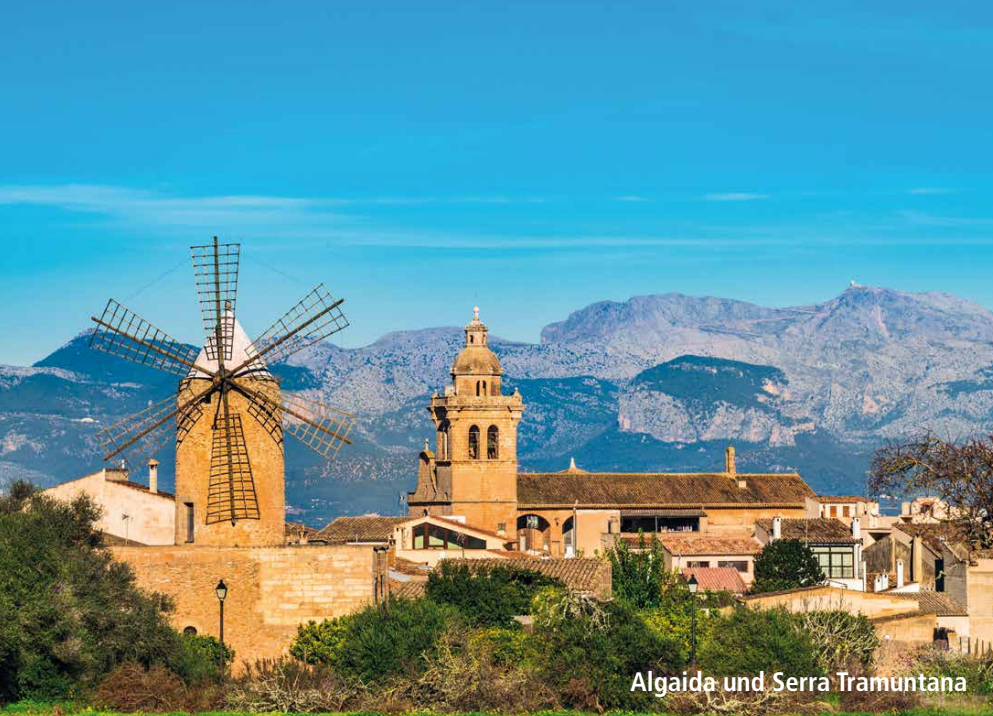
Algaida und Serra Tramuntana