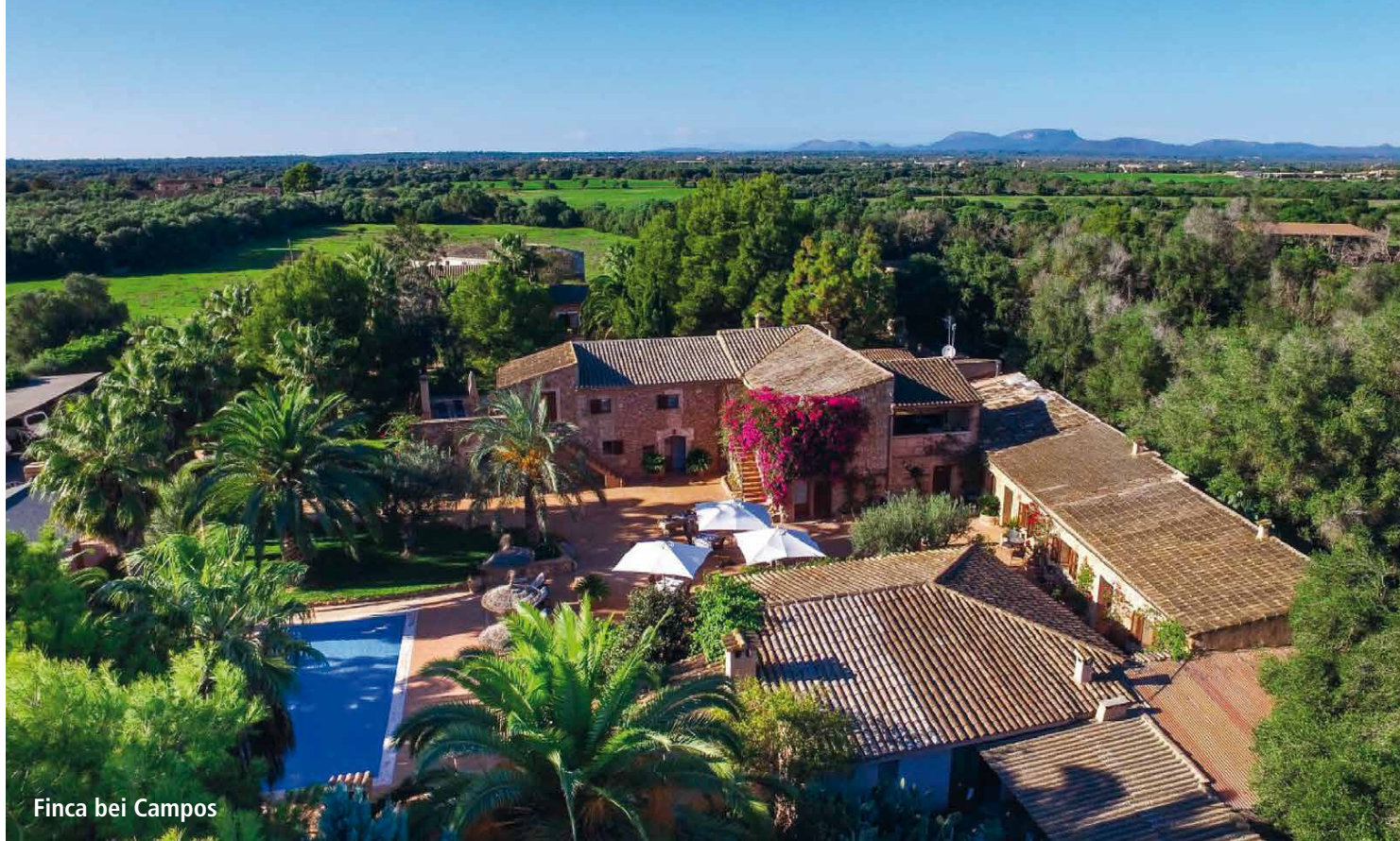
Finca bei Campos