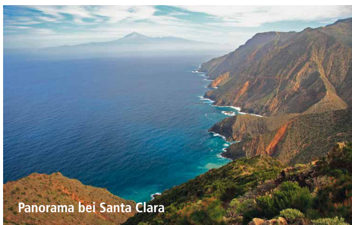
Panorama bei Santa Clara