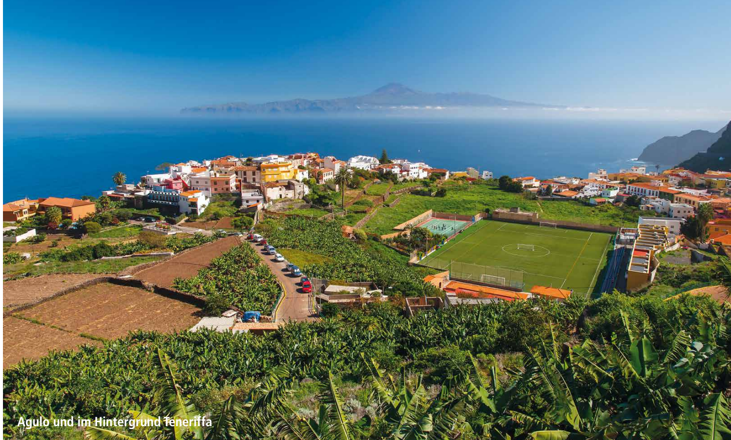
Agulo und im Hintergrund Teneriffa