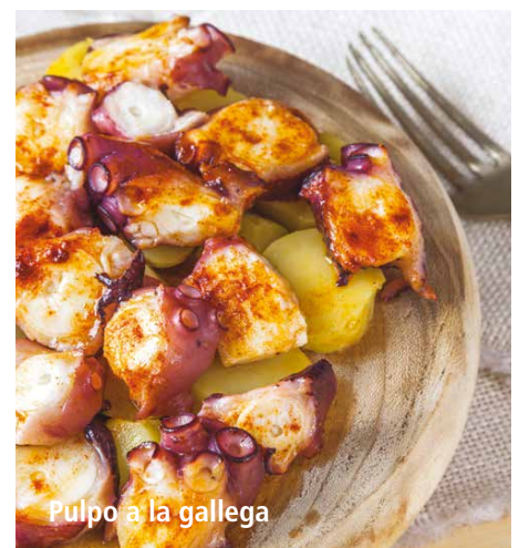
Pulpo a la gallega