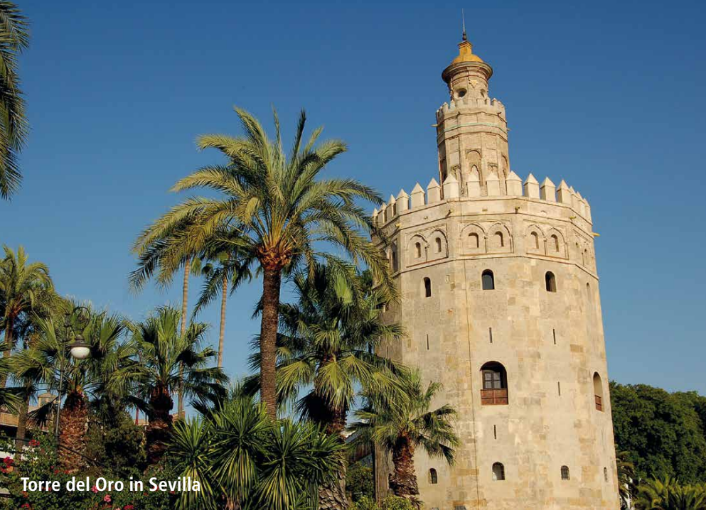
Torre del Oro in Sevilla