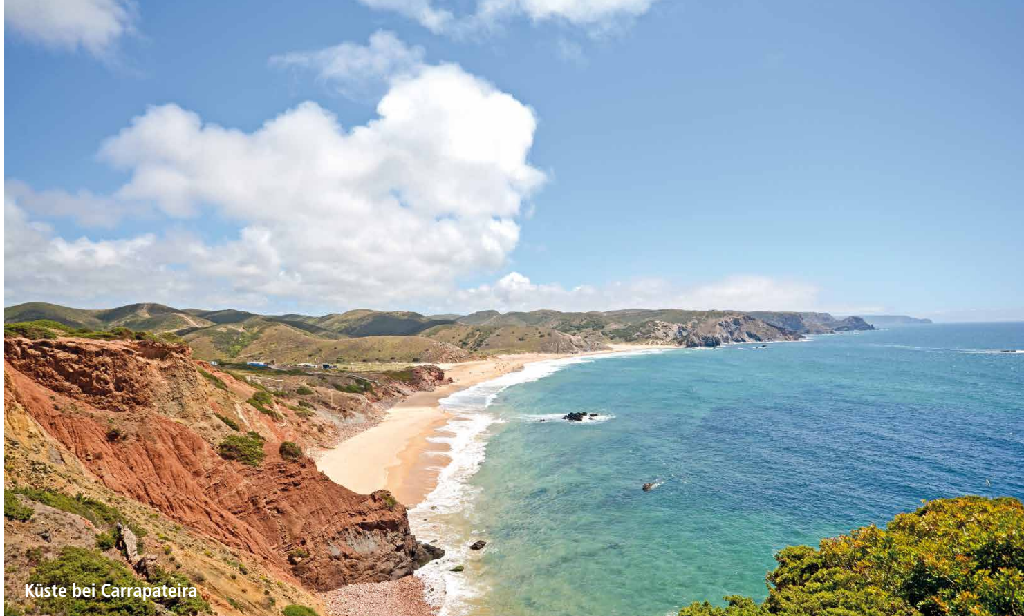
Küste bei Carrapateira

Häusern, roten Dächern und gepflasterten Plätzen. 3 km am Flussufer entlang präsentiert Odeceixe seinen Hausstrand, die wohl schönste Sand- und Badebucht der Tour (ca. 50 km, 510 Hm).