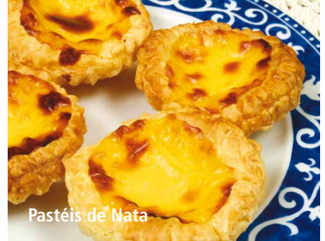
Pastéis de Nata